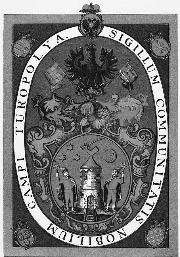
Grb Plemenite općine turopoljske